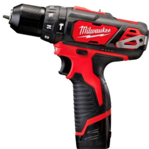
Taladro Percutor SubCOMPACTO M12