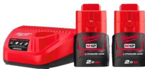
Pack M12NRG-201 Cargador + 2 Baterías 12V 2.0 Ah