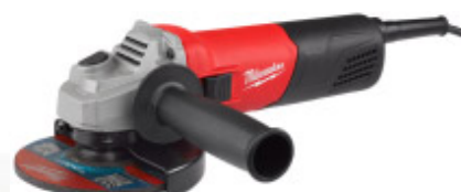
AG 800-115 E