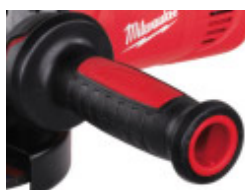
AGV 17-180 XC/DMS